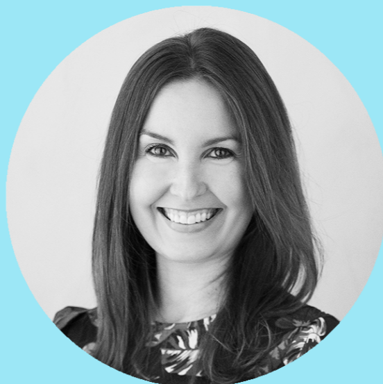
Eeva Kalli Keskustan kansanedustaja